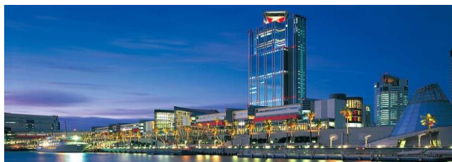
阪神高速使用 大阪南港 約32.0 km 30分