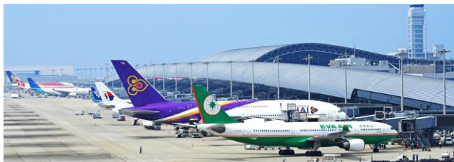
阪和自動車道使用 関西国際空港 約28.0 km 25分