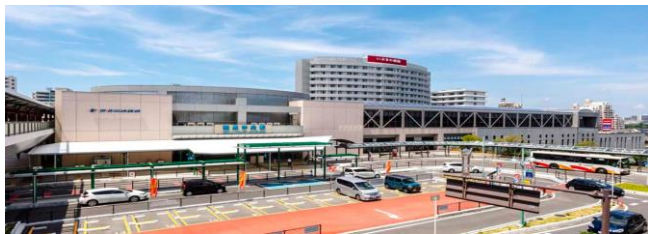
泉北高速鉄道使用 「和泉中央」 駅 約2.5 km 5分

阪和自動車「岸和田和泉」ICに近く、大阪市中心部をはじめとする近畿エリア各地への広域アクセスが良好で多頻度・緊急配送の拠点として、ポテンシャルの高い立地を誇ります。南大阪の中心として全地域をカバーする拠点としても最適です。