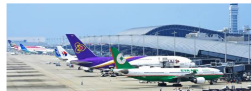
阪和自動車道使用 関西国際空港 約28 km 25分