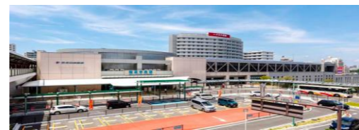
泉北高速鉄道使用 「和泉中央」駅 約2.5 km 5分