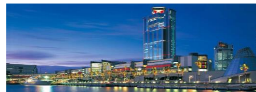
阪神高速使用 大阪南港 約32 km 30分